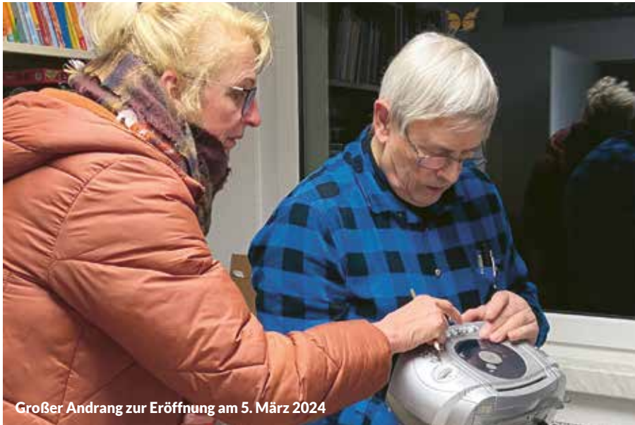
Großer Andrang zur Eröffnung am 5. März 2024

Die WBV beteiligt sich aktiv an der Umsetzung des „gebietsbezogenen integrierten Handlungskonzeptes Coswig“ (GIHK), welches von der EU gefördert wird. Hinter diesem etwas sperrigen Namen verstecken sich zahlreiche Angebote von verschiedenen Einrichtungen und Vereinen der Stadt Coswig. Ziel des Konzeptes ist es, vor allem in den Stadtteilen Dresdner Straße und Spitzgrund die Situation von Familien, Kindern und Jugendlichen zu verbessern, Menschen auf Arbeitssuche begleiten und zu unterstützen, und das