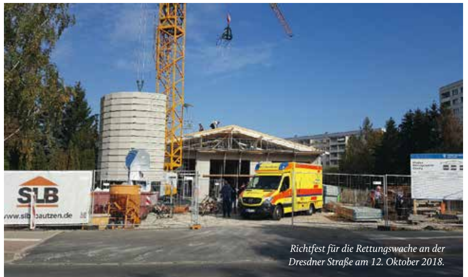
Richtfest für die Rettungswache an der Dresdner Straße am 12. Oktober 2018.

Baustart im Frühling, Richtfest im Oktober! Ab dem 1. April 2019 soll die Rettungswache an der Dresdner Straße 34 ihren Betrieb aufnehmen. Die WBV hat rund 1.4 Millionen Euro in den Neubau investiert und mit dem Landkreis Meißen für die nächsten 20 Jahre einen Mietvertrag abgeschlossen. Erwartet werden rund 4000 Einsätze im Jahr, die Notfall- und Rettungssanitäter der Malteser fahren in Coswig, Radebeul und Moritzburg zum Einsatz. Ein Fahrzeug ist immer vor Ort, das Zweite von 7 bis 19 Uhr.